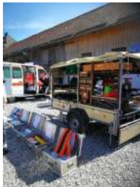
Aktionstag Bauernhof Huglfing